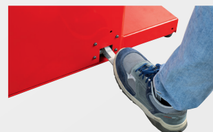
8-21900207 PB Freno de pedal