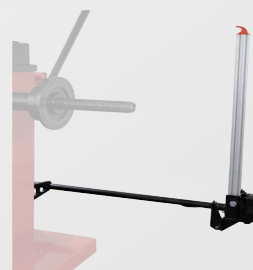
8-21900209 TL-2 UP Medidor de anchura de llanta con soporte