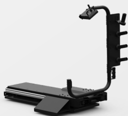
8-21100161/90 WL 80 UP Elevador de rueda