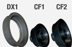
8-21100141 DX/CBF Accesorio de centrado para furgonetas y SUV con orificio central Ø 117-173 mm