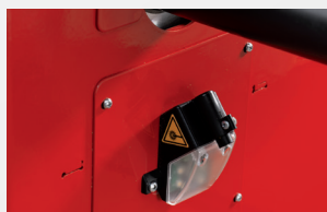
8-21100238 LL Kit iluminador interno de rueda LED + puntero láser